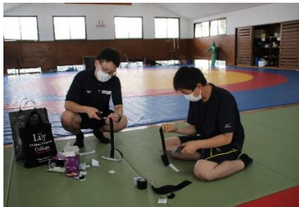
スポーツの仕事(テーピング講座)