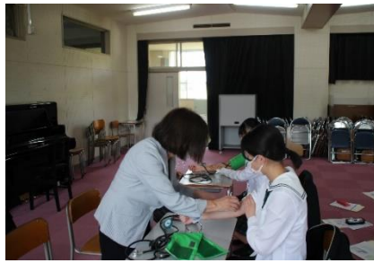
看護・医療の仕事(血圧・脈拍測定体験)