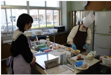
フードの仕事(クレープ調理体験)