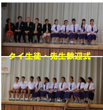
タイ生徒、先生歓迎式

21 回目を迎えたタイとの交流。今年は、15人の生徒と5人の先生を迎え、大子清流高生との交流を深めました。