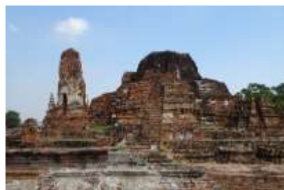
多くの寺院・遺跡を見学し、タイの歴史を学びました。