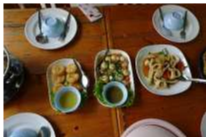
料理の味付けはやはり辛いものが多く恐る恐る箸を伸ばしました。