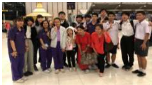
名残惜しさをこらえつつタイをあとにしました。