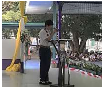
歓迎式典でのスピーチ。いよいよ10日間の交流が始まります。

今年で25回目を迎えたタイ王国との交流。異文化に触れる戸惑いもあったようですが、タイの人々が温かく向え入れてくれたおかげですぐに打ち解けることができました。タイ料理を作ったり、現地の高校生と交流したり、民芸品を制作したりとタイ王国の文化を体験しました。自分自身の成長を実感し、日本へ戻ってきました。