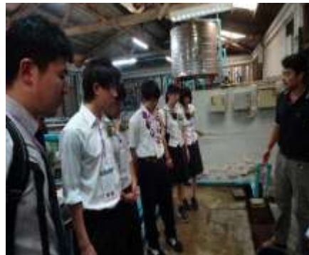
現地の学校には様々な施設があります。写真は魚の養殖場の様子です。