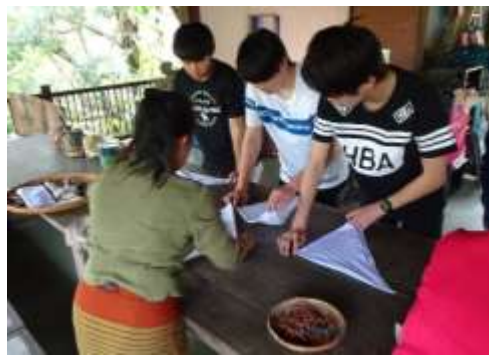
タイでは様々な民芸品の製作を体験しました。