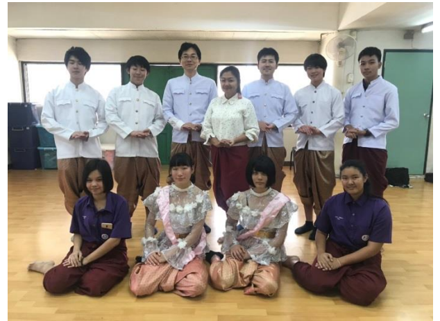
タイの民族衣装を着て, 舞踊を学びました。