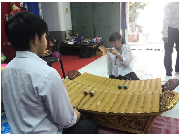
タイの伝統楽器を練習