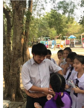
左, 中央: 英語の授業。右: 昼休み, 子ども達と, 触れ合い